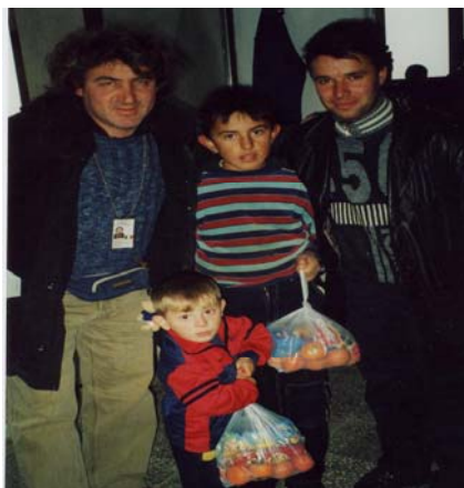
Umberto e il Direttore della scuola di Kotlina consegnano i pacchetti dono