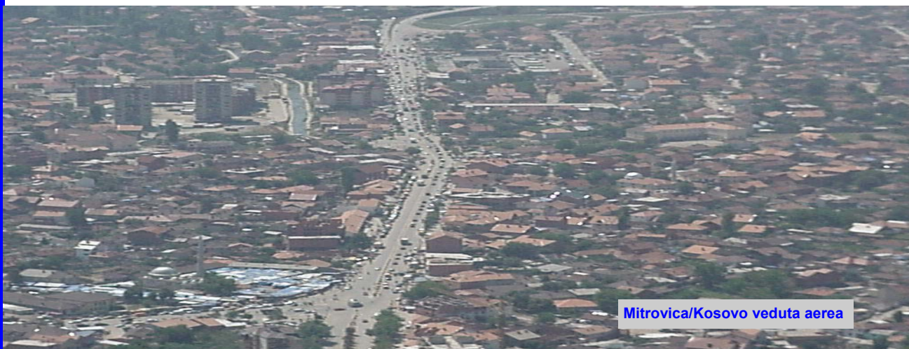
Mitrovica/Kosovo veduta aerea