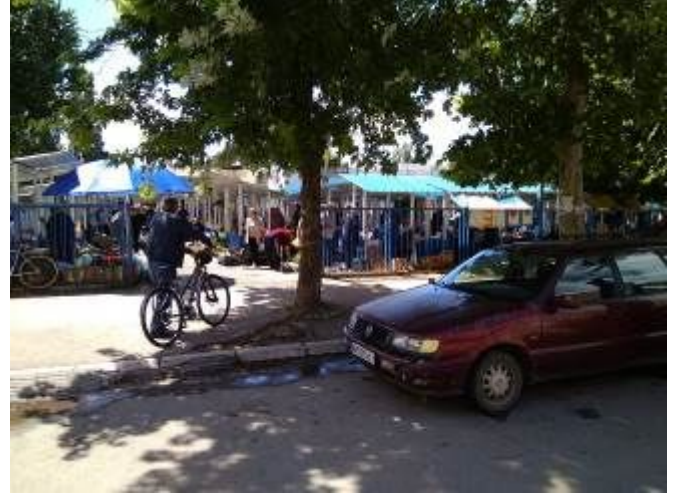
Il mercatino pare non essere solo luogo di scambio commerciale, è sicuramente punto d'incontro per la popolazione.