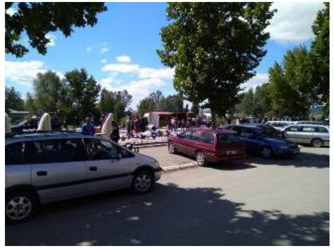
A ridosso del ponte principale di Mitrovica, nella parte nord quella serba, è attivissimo il piccolo mercatino.