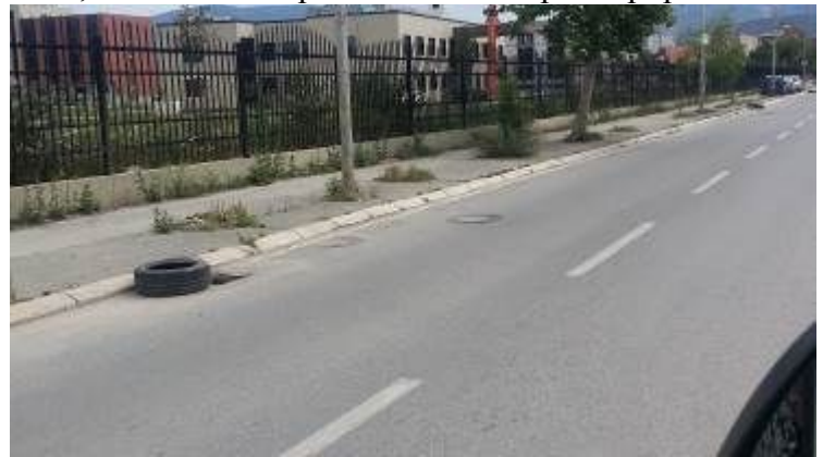
Concludiamo il capitolo del nostro Kosovo con le immagini del viale che costeggia i nuovi edifici universitari.