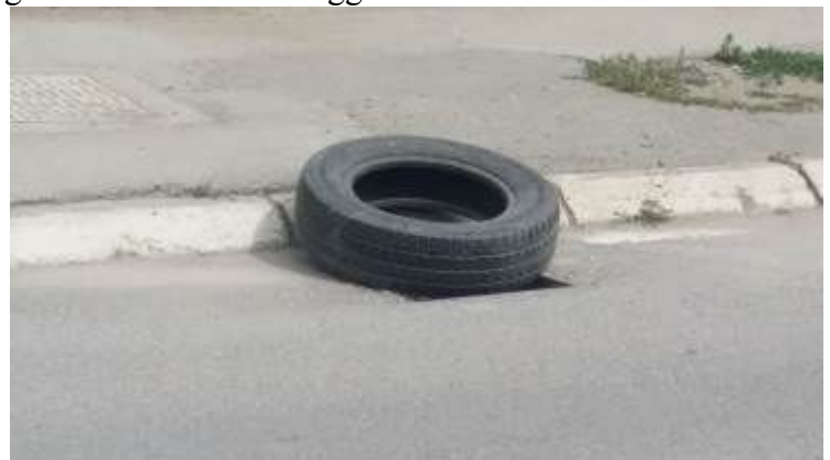
Lungo tutto il viale sono spariti i chiusini lasciando aperti profondi buchi. La gente vi ha posto rimedio dislocando su ogni tombino un pneumatico usato per evitare rovinosi danni ad auto e persone. Ovviamente la situazione non è rimediabile in altra maniera, se rimettessero i chiusini li ruberebbero nuovamente.