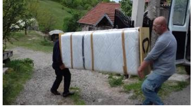
Ultime fatiche prima di concludere le donazioni. Anche questa volta la fatica è stata tanta ma la soddisfazione e la gioia per aver risolto numerosi problemi è la più bella ricompensa, ora ci fermiamo un attimo ma ottobre è vicino.