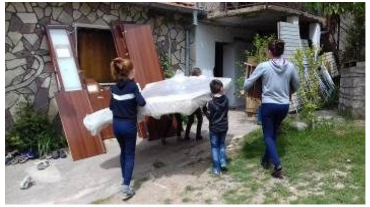
Alcuni bimbi si consorziano e insistono per trasportare un ingombrante materasso, vigiliamo ma li lasciamo fare.