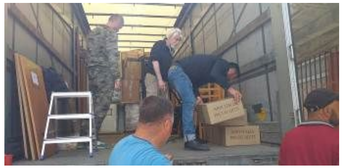
Per la grande quantità di materiali, abbiamo organizzato uno scarico articolato, prevedendo consegne immediate.