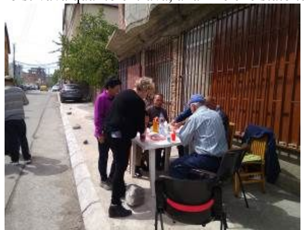
Come sempre alla fine abbiamo offerto uno spuntino ai volontari e subito dopo abbiamo iniziato le consegne.