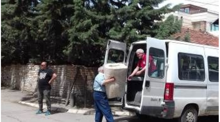
Il materiale dal camion veniva passato a secondo del beneficiario sul pulmino, su un camioncino o in magazzino.