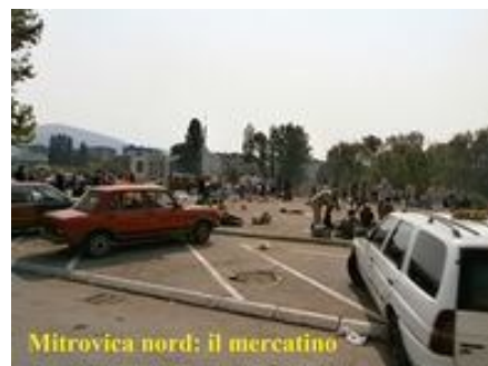
Mitrovica nord: il mercatino