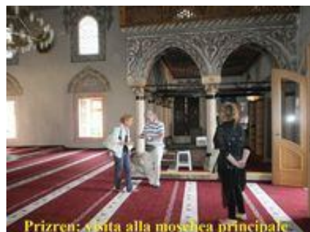
Prizren: visita alla moschea principale