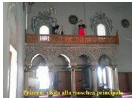
Prizren: visita alla moschea principale