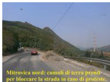
Mitrovica nord: cumuli di terra pronti per bloccare la strada in caso di proteste.