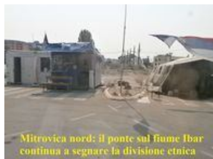
Mitrovica nord: il ponte sul fiume Ibar continua a segnare la divisione etnica