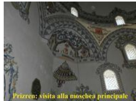
Prizren: visita alla moschea principale

Giungiamo alla sede dei sordomuti e come sempre siamo accolti affettuosamente e con tanta allegria. Questo è un gruppo davvero attivo, fantasioso e simpaticamente casinista. Però sono un gruppo ben organizzato e condividono pienamente le proprie finalità. Il mese scorso abbiamo finanziato la sistemazione della sede dei sordomuti, due piccoli locali malsani e abbandonati sono ora funzionali alle attività sociali dei 33 soci. Con il nostro finanziamento di 2700 euro ora dispongono di uno spazio idoneo alla vita sociale, in questi ambienti giocheranno, trascorreranno le loro giornate, il lavoro è stato svolto interamente da loro. 9 sono le associazioni comprese nel Progetto sostegno famiglie, 200 i pacchi aiuti consegnati in ogni missione, ma poi ci sono anche pannoloni, pannolini, farmaci, borse di studio, legna, e molto altro. La regola suggerita dalle Ong locali e da noi adottata è niente denaro ma aiuti. Con questa semplice regola possiamo aiutare molte famiglie donando un pò a ciascuno, qualcuno riceve solo i farmaci, altri i generi alimentari altri ancora pannoloni o pannolini, nei casi disperati doniamo più tipologie d'aiuto alla stessa famiglia. Importante è il nostro contributo sanitario alle grandi necessità sanitarie dei malati kosovari. Il problema non è l'emergenza ma la quotidianità, spesso le malattie vengono affrontate senza grandi difficoltà, o in Kosovo o nei paesi limitrofi, Albania, Turchia o Macedonia. Ma è il dopo che crea il problema, le stomie necessitano