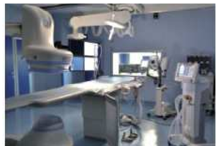
Sala di emodinamica